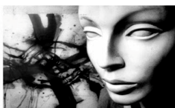
SALETTA TEMPO GIOVANE - via Europa • TORREGLIA • ORE 21 INGRESSO LIBERO

Informazioni specifiche sugli eventi al sito: http://www.fondoambiente.it